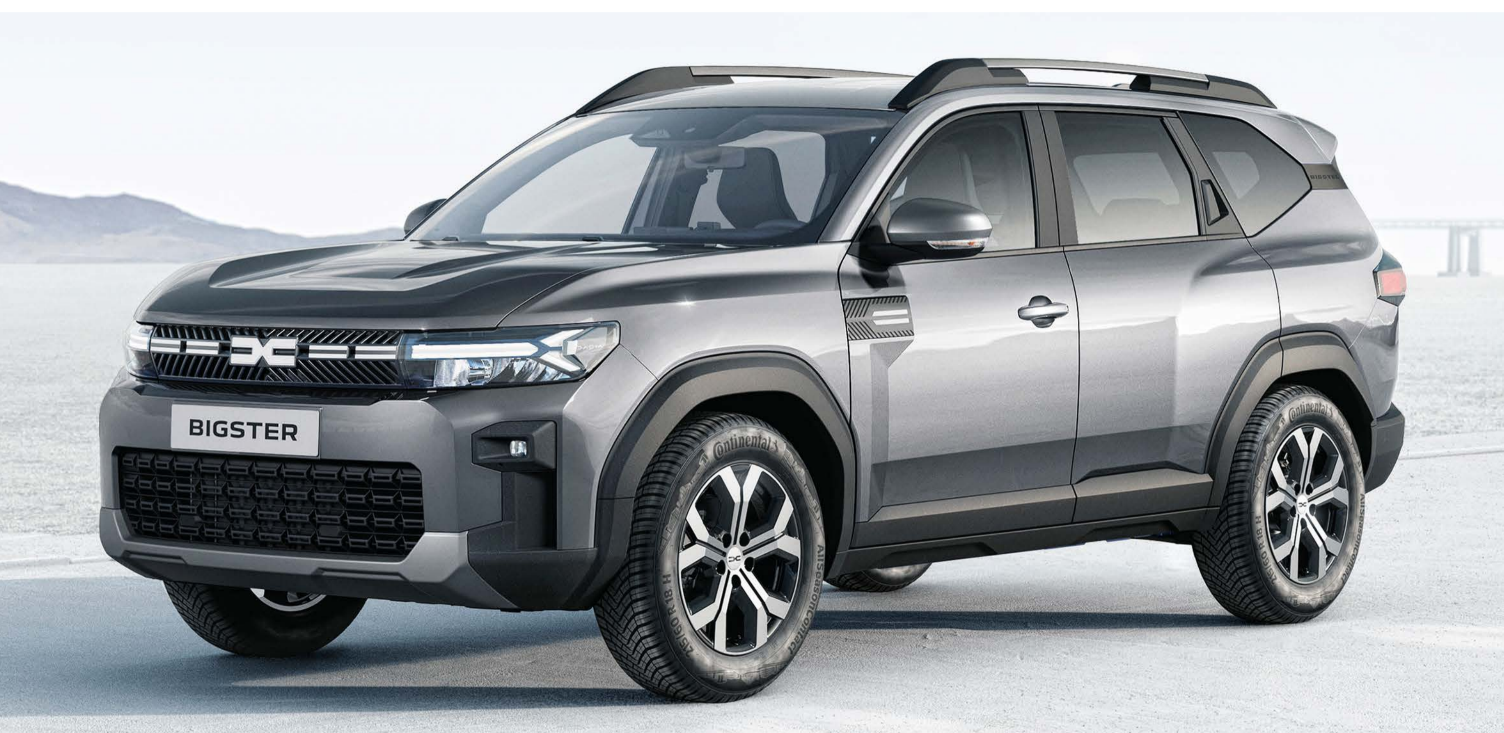
GRIGIO SCISTO (2)