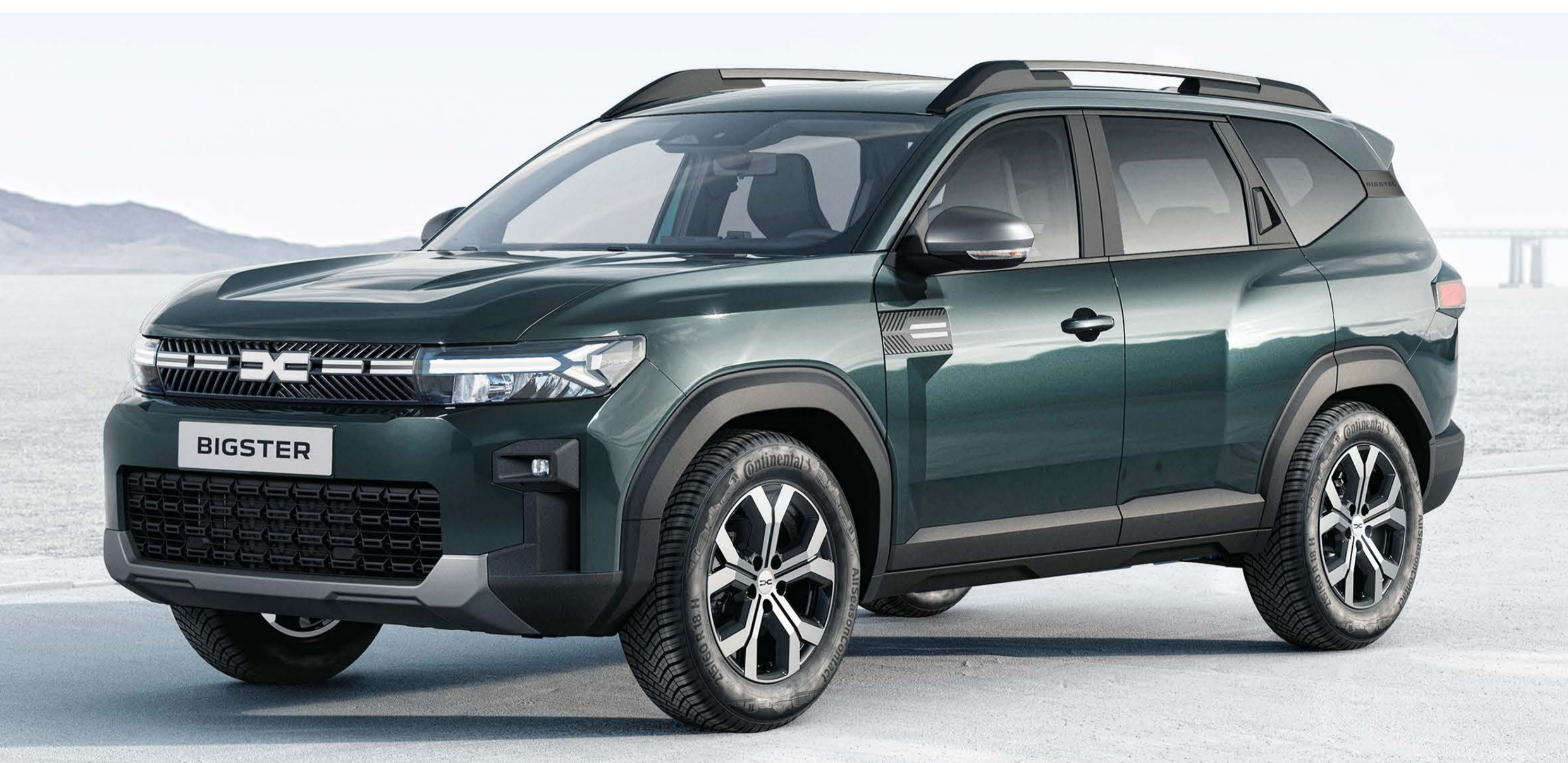
VERDE OXIDE (2)