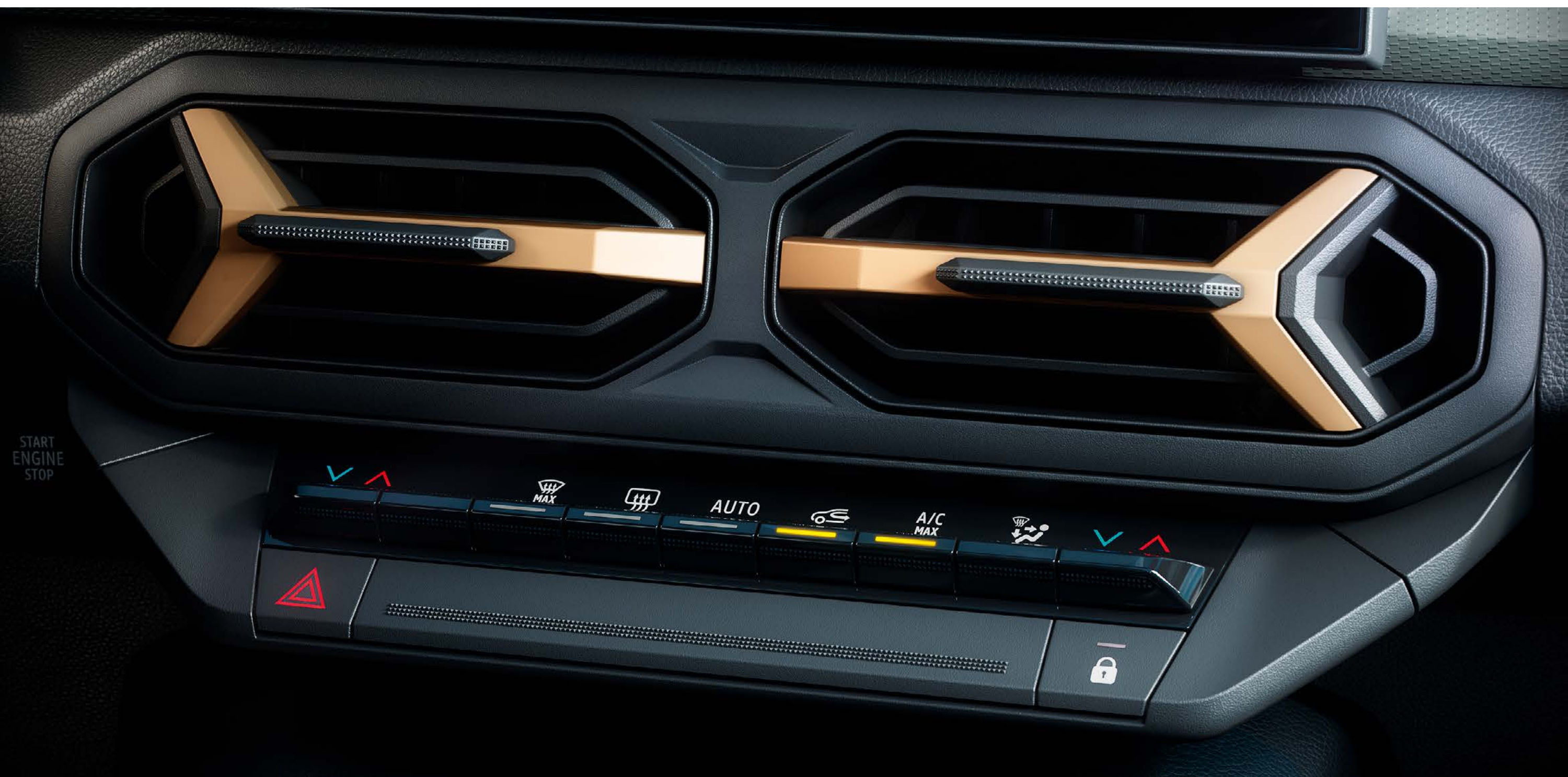
Climatizzatore automatico bi-zona

Progettato per garantire il massimo comfort a cinque passeggeri, l'abitacolo gode di un livello ottimizzato di insonorizzazione che ti permette di apprezzare la qualità sonora del sistema audio Arkamys® 3D con sei altoparlanti, mentre il climatizzatore automatico bi-zona con bocchette di ventilazione dedicate ai sedili posteriori assicura il benessere di tutti gli occupanti.