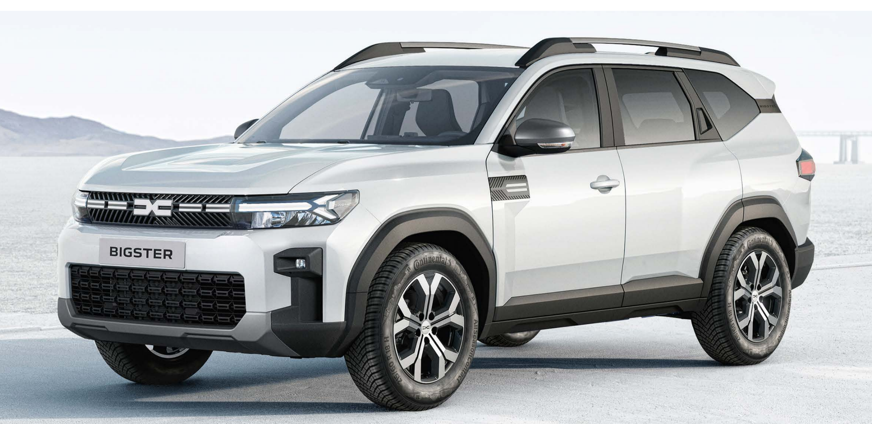
BIANCO GHIACCIO (1)