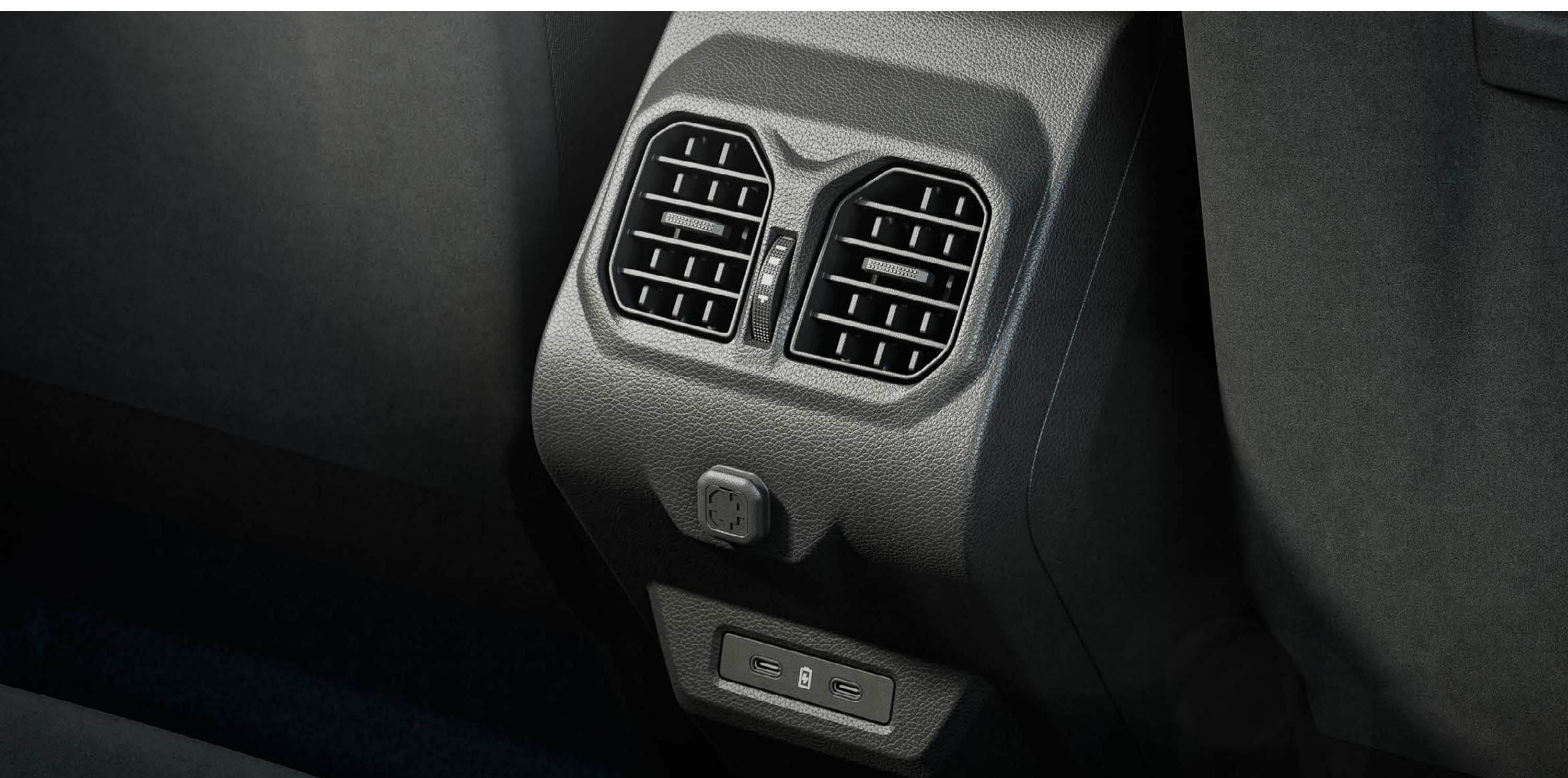
Bocchette di ventilazione posteriori