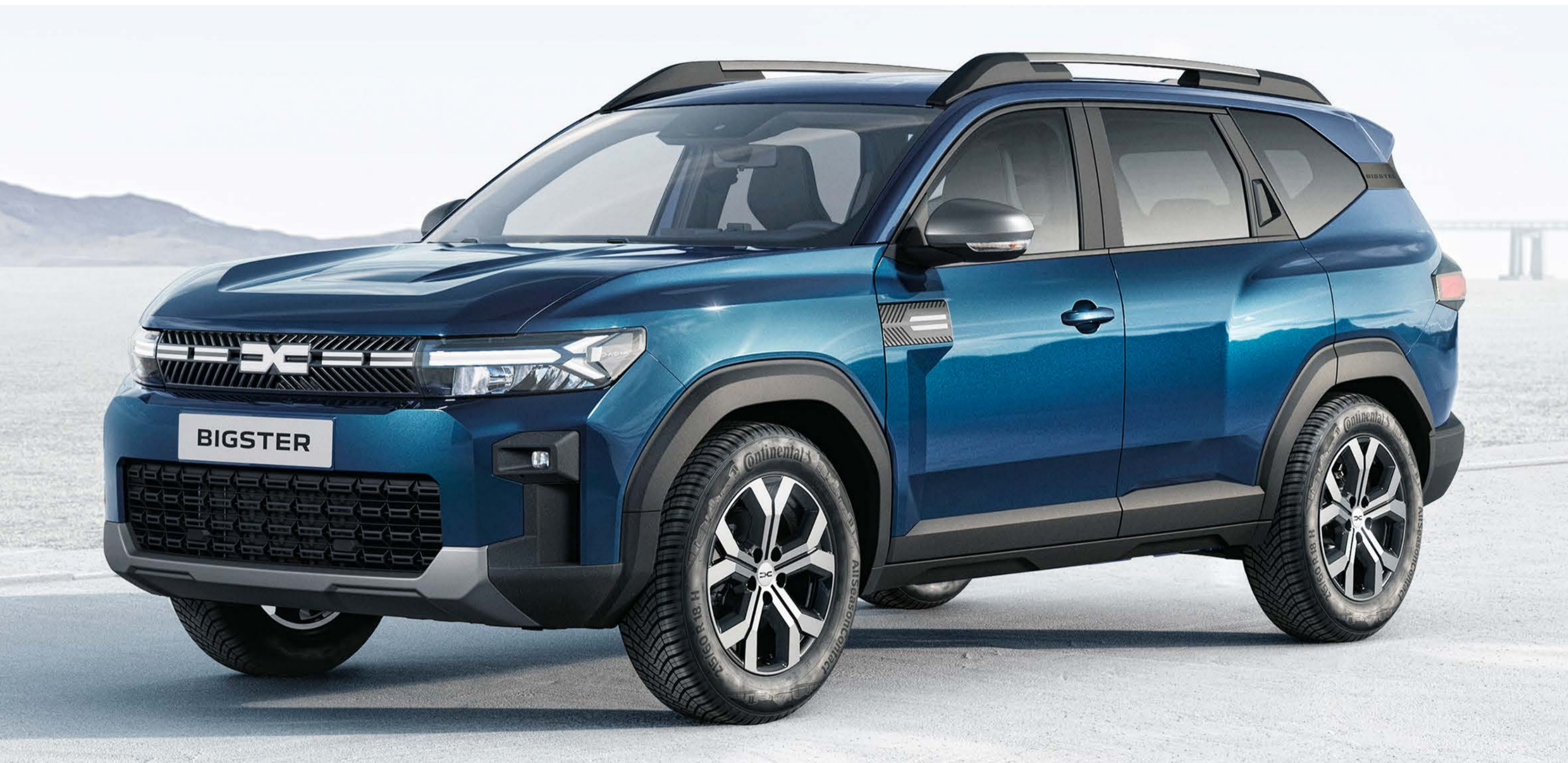
BLU INDIGO (2)