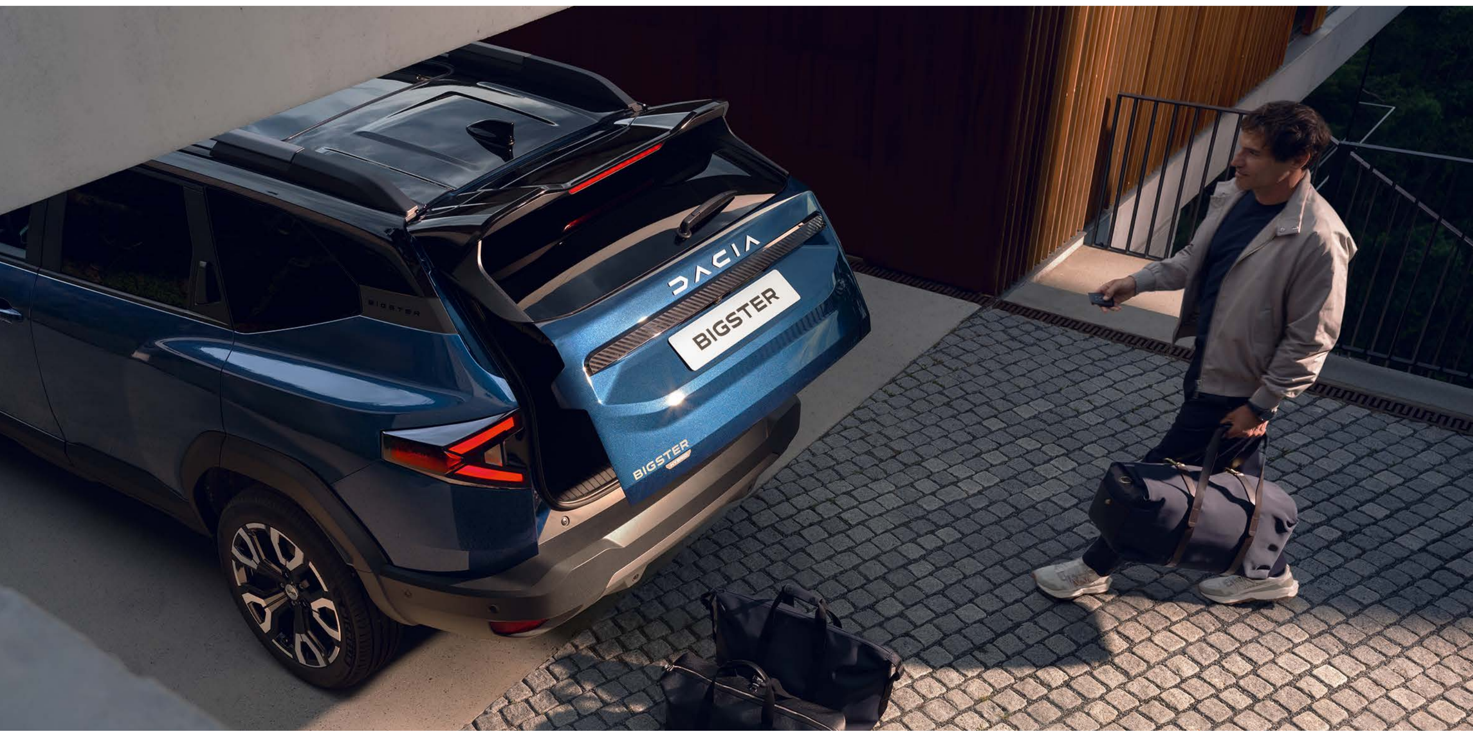
Portellone posteriore elettrico