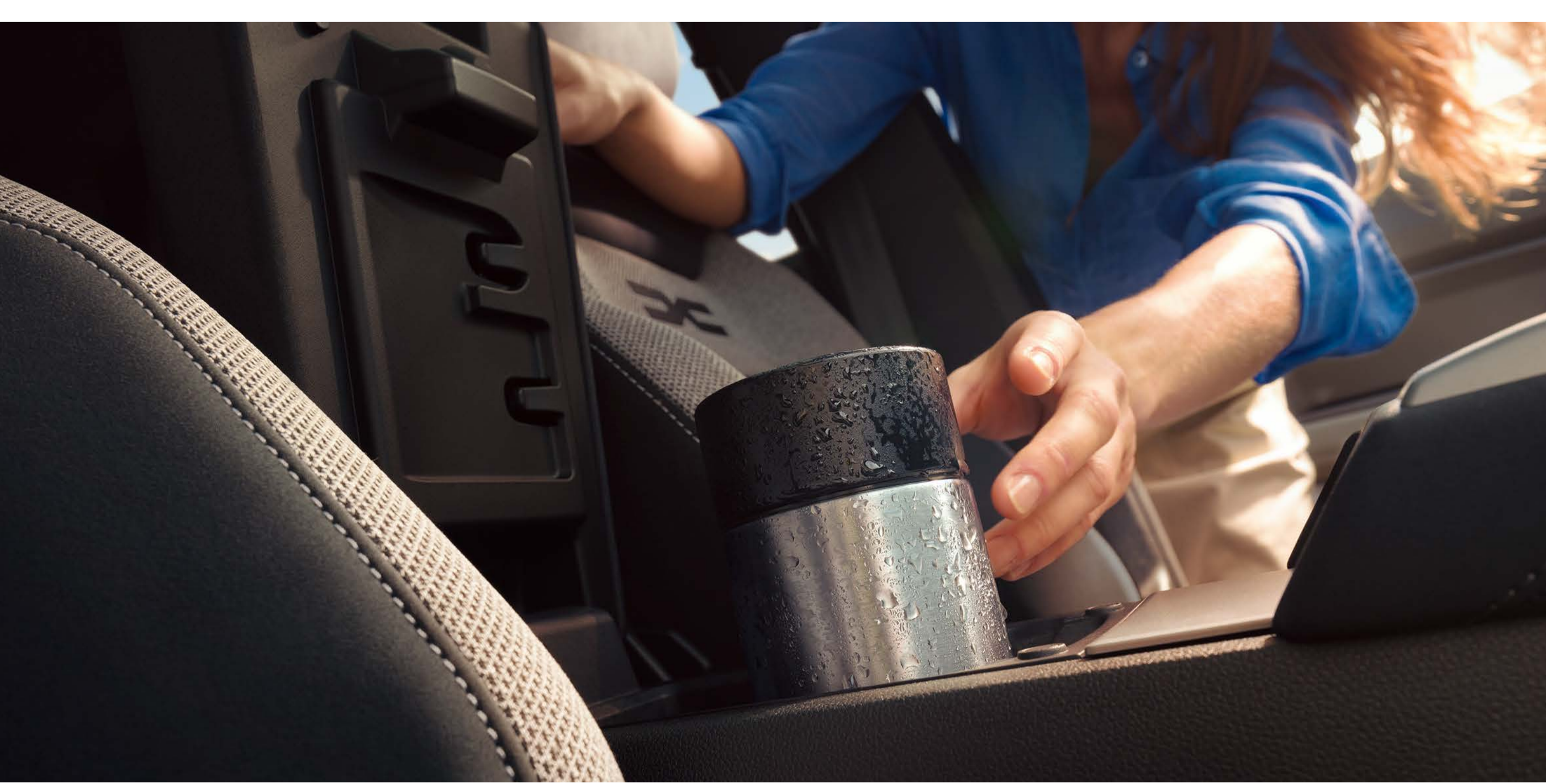
Vano portaoggetti refrigerato