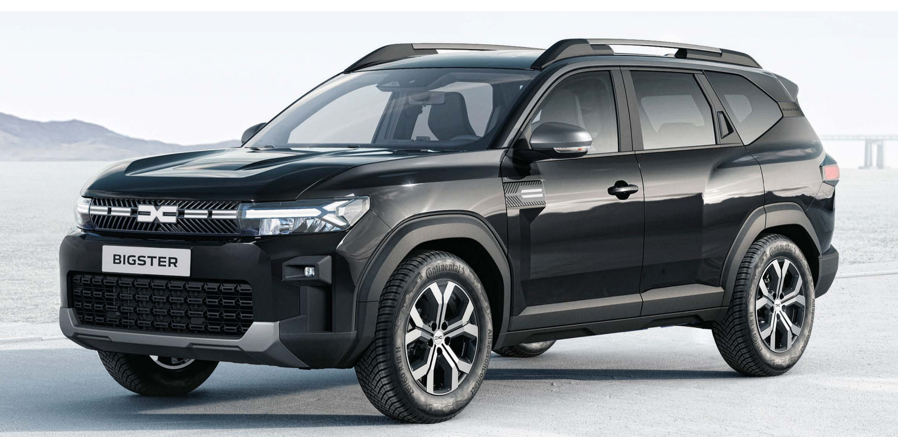
NERO NACRÉ (2)