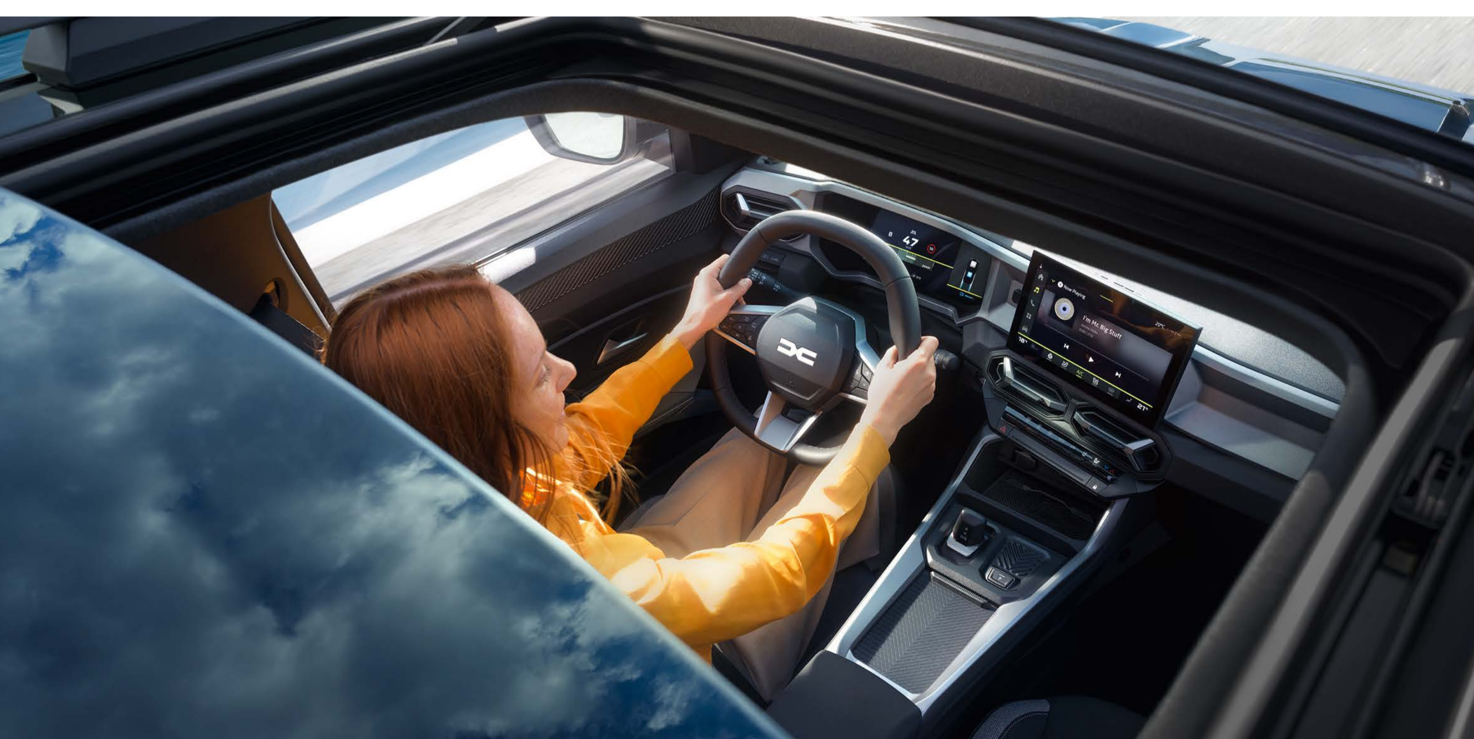
Tetto apribile panoramico

La versione con bi-tono (tetto in nero) e la distintiva tinta Blu Indigo ne esaltano l'eleganza, che si completa con il tetto apribile panoramico capace di garantire una luminosità interna impeccabile. C'è un Bigster perfetto per ogni tua esigenza.