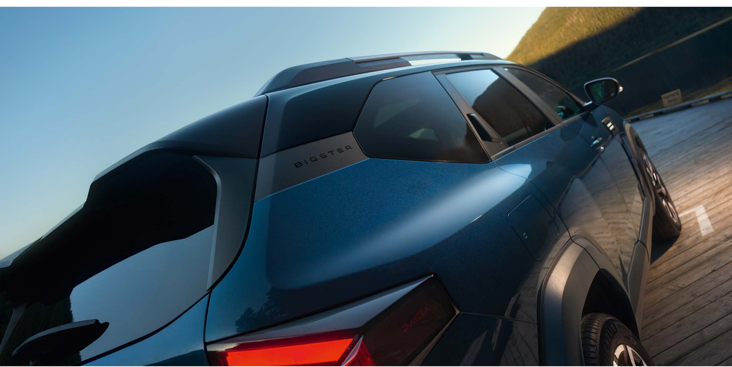
Esclusiva tinta bicolore